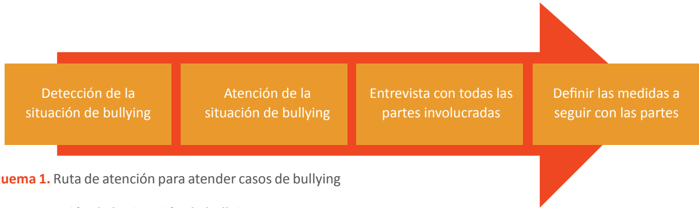
Esquema 1. Ruta de atención para atender casos de bullying